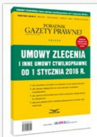
Umowy zlecenia i inne umowy cywilnoprawne od 1 stycznia 2016 r. (książka)