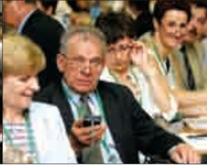
Równie uważnie trzeba sprawdzić urządzenie do głosowania