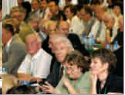
Sprawozdania i wystąpienia wymagają skupienia