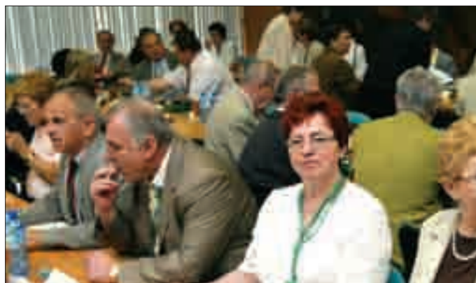
Uczestnicy w pełnej gotowości – za chwilę początek obrad