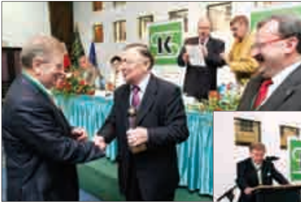
Uroczyste wręczenie pamiątkowych statuetek