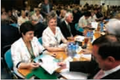
Uważnie należy słuchać wystąpień