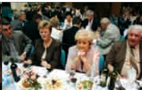
Spokojnie można zjeść, porozmawiać