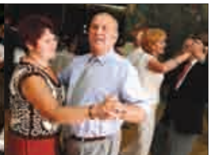
No i trochę potańczyć, zwłaszcza po tylu godzinach siedzenia