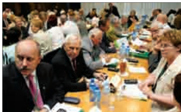
Zjazd sprawozdawczo-wyborczy to przede wszystkim wyłożona praca