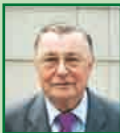
prezes prof. Zbigniew Messner