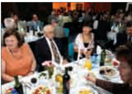
Uroczysty wieczór – zasłużona chwila oddechu